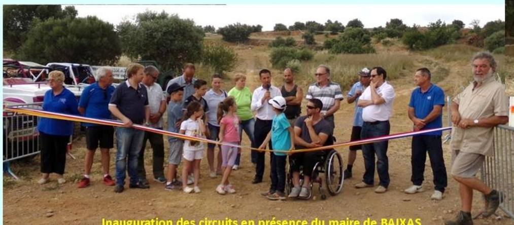
Inauguration des circuits en présence du maire de BAIXAS