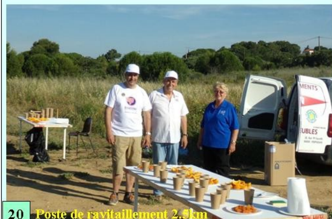
20 Poste de ravitaillement 2,5km