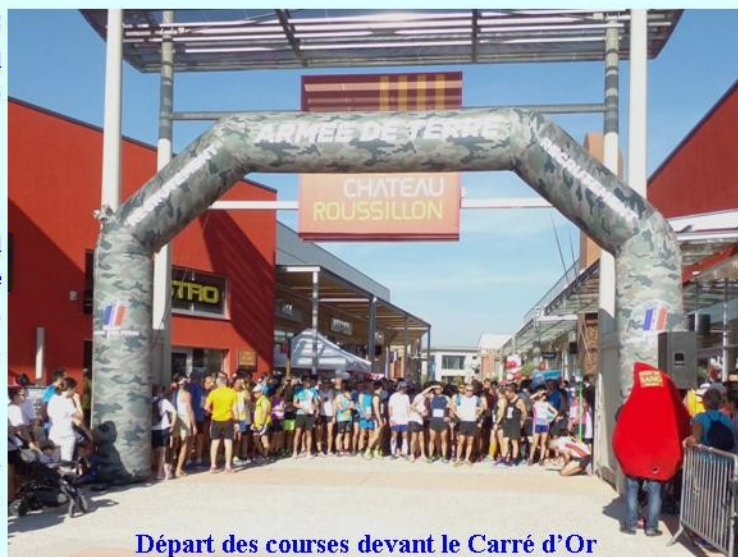
Départ des courses devant le Carré d'Or

Une marche nordique, une randonnée pédestre et une course d'enfants venaient compléter ces deux compétitions.