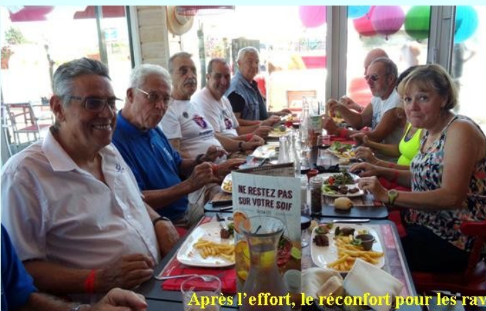
Après l'effort, le réconfort pour les ravitailleurs de la course de La PERPINYANE des Vignes