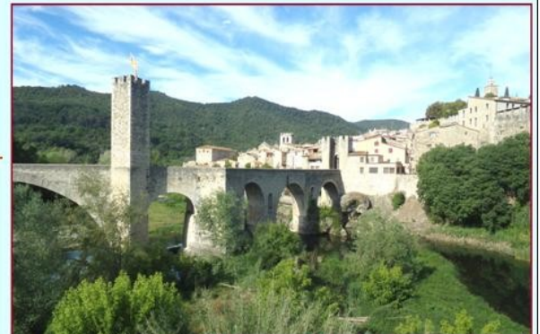
Village médiéval de Besalú

Sans perte de temps direction le charmant village médiéval de Santa Pau, juché sur une petite colline au beau milieu du parc naturel de la zone volcanique de la Garrotxa. De sa silhouette de pierres se détache le château dont la façade principale s'ouvre sur une place à arcades ou Firal desl bous (boeufs) et bordée de l'église paroissiale Santa Maria, du XV-XVIème siècle avec son « pessebre permanent », crèche permanente. ./.