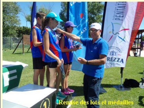
Remise des lots et médailles