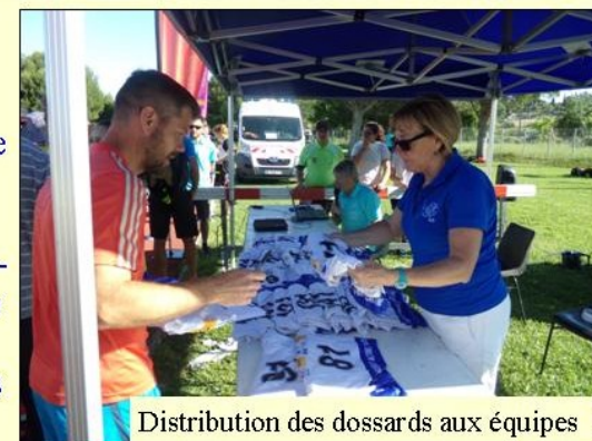
Distribution des dossards aux équipes