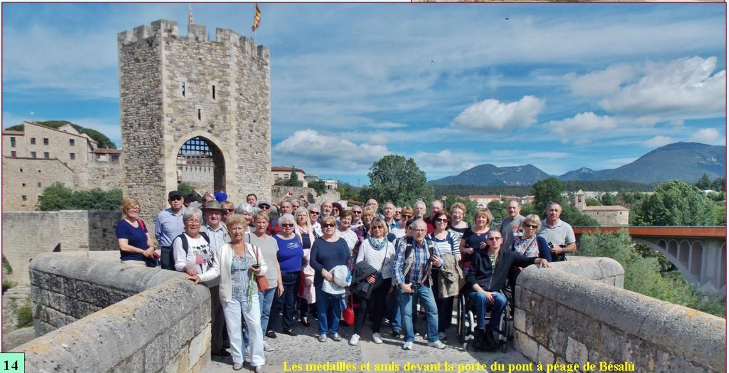
Les médaillés et amis devant la porte du pont à péage de Bésali