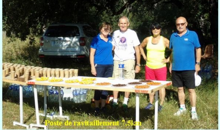
Poste de ravitaillement 7,5km