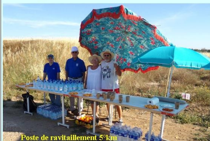
Poste de ravitaillement 5°km

Sept stands de ravitaillement tenus par le CDMJSEA 66 étaient répartis sur le parcours sous un soleil de plomb.