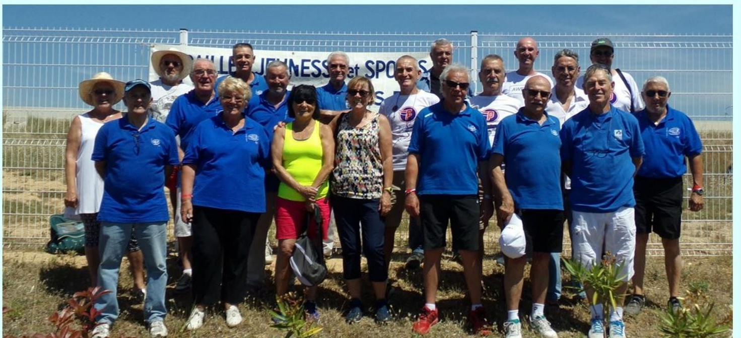
Photo de famille des ravitailleurs de la course de La PERPINYANE des Vignes