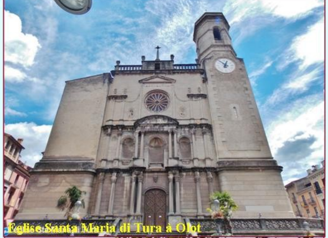
Eglise Santa Maria di Tura à Olot