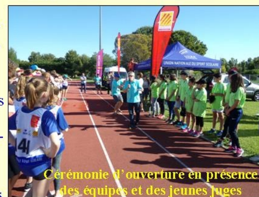
Cérémonie d'ouverture en présence des équipes et des jeunes juges