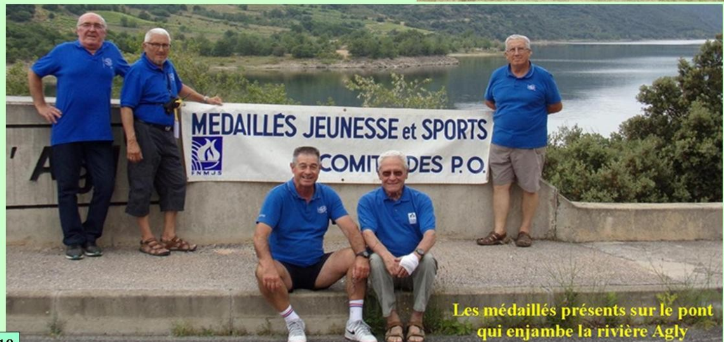
Les médaillés présents sur le pont qui enjambe la rivière Agly