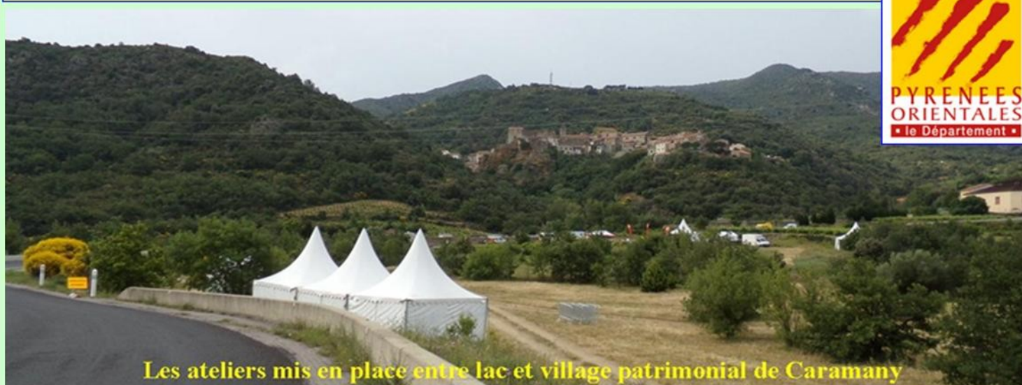
Les ateliers mis en place entre lac et village patrimonial de Caramany

Pour la 6ème édition du Raid Nature des Collèges organisée par le Conseil départemental des Pyrénées Orientales, les médaillés de la JSEA étaient une nouvelle fois présents afin de renforcer les différents ateliers proposés cette année, sur et autour du plan d'eau de Caramany, site remarquable classé.