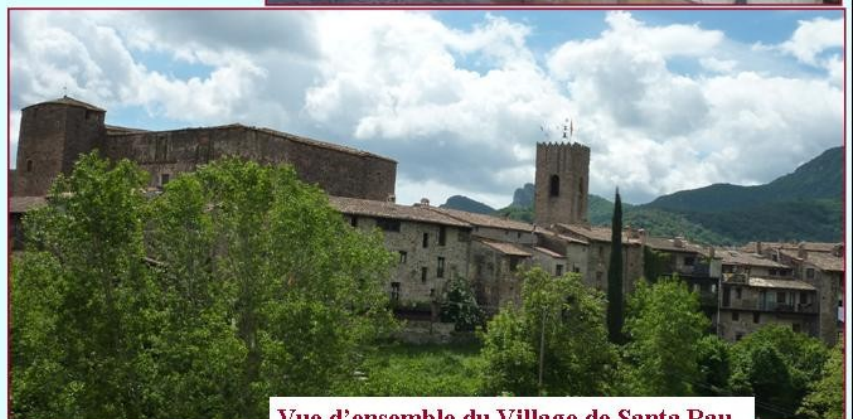
Vue d'ensemble du Village de Santa Pau