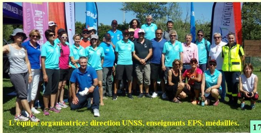
L'équipe organisatrice: direction UNSS, enseignants EPS, médaillés.