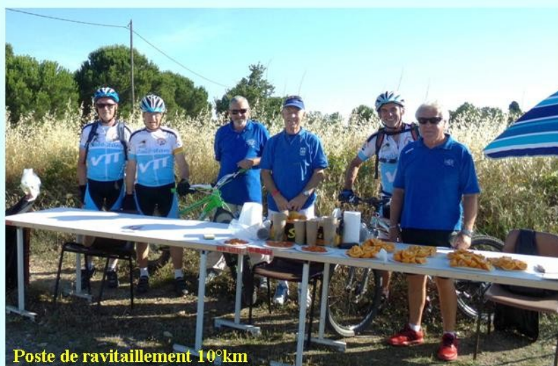
Poste de ravitaillement 10°km