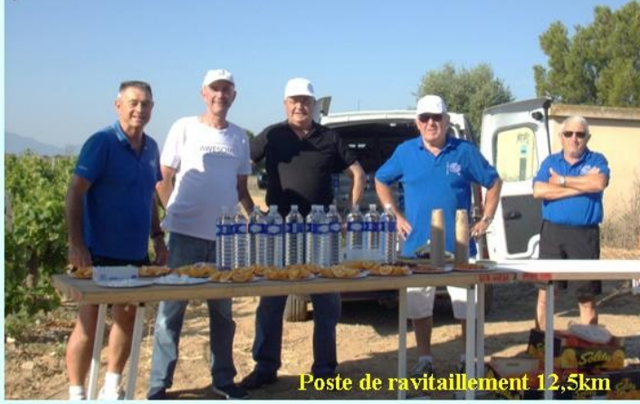
Poste de ravitaillement 12,5km