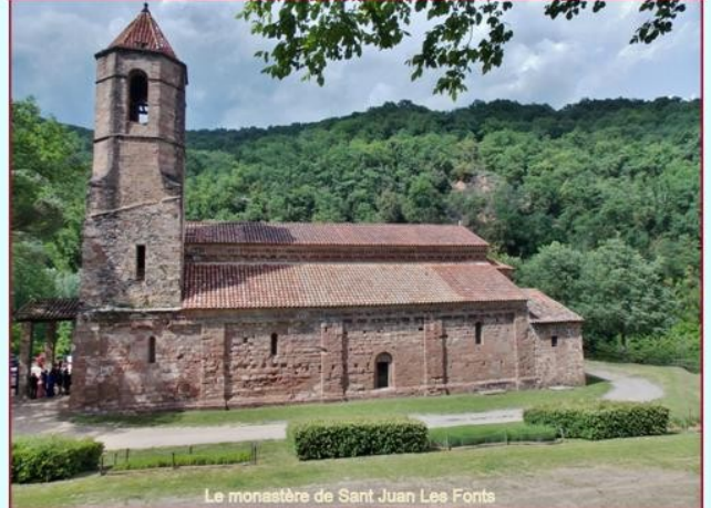
Le monastère de Sant Joan Les Fonts