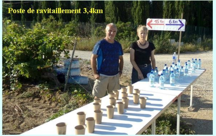
Poste de ravitaillement 3,4km